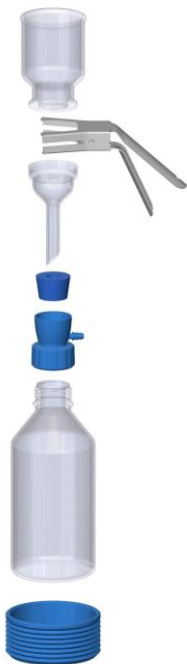
VF12 filtration set