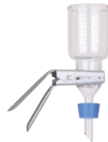
Rocker, 300ml VF 6 玻璃過濾漏斗 (167120-31)