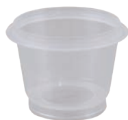
Millipore, 100 / 250 ml Microfl, 拋棄式過濾杯 (MIACFD101 / MIACFD201)