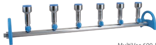
MultiVac 600-MS 6孔不鏽鋼過濾座 (180600-01)