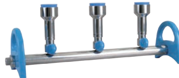
MultiVac 300-MS 3孔不鏽鋼過濾座 (180300-01)