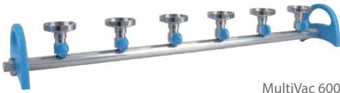
MultiVac 600 - MB 6孔不鏽鋼過濾座 (180600-02)