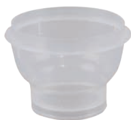
Sartorius, 100 ml 拋棄式過濾杯 (16A07)