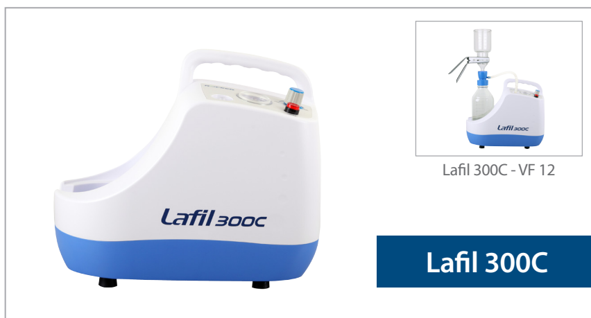
Lafil 300C - VF 12