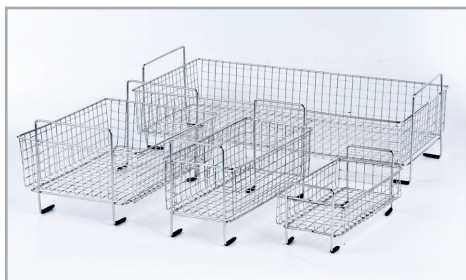
洗籃 (選配) 用以放置小型多量物件