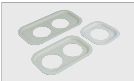
燒杯固定架 (選配) 用以間接清洗時 固定裝洗劑的燒杯